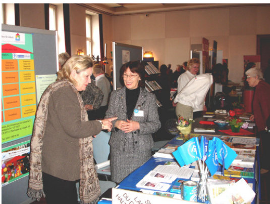
Auf der Ehrenamtsmesse im Rathaus

Mit weiteren potentiellen Sponsoren sind wir im Gespräch.