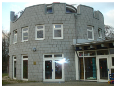
Besichtigung Kinderhaus Bad Oldesloe

Das Kinderhaus wird das Zentrum des Kinderschutzbundes in Lübeck. Neben der Einrichtung "Spielen und Lernen", Krippe, Familiengruppe, Hortangebot, Elternkurse und Elternberatung, Hausaufgabenhilfe, Sprachförderung u.v.m. werden mit der Falkenfeldschule offene und betreute Lerneinheiten sowie ein tägliches Mittagessen angeboten. Elternberatung auch durch externe Fachkräfte, Begegnungstreffen und ein Netzwerk "Lernen und Ausbildung" in Zusammenarbeit mit bereits bestehenden Einrichtungen sind in Vorbereitung.