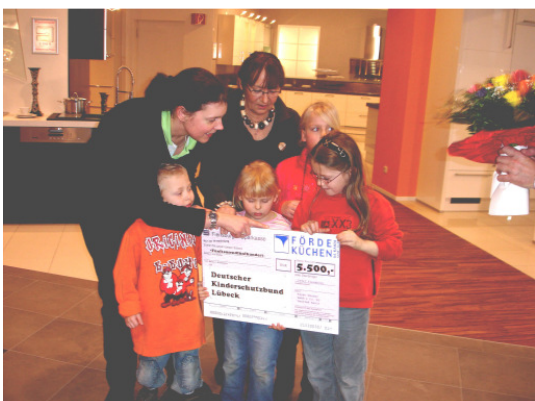
Die Josephinenstr. bei einem Sponsor

Wir informieren Sie weiterhin. Helfen Sie uns mit Ideen und weiteren Vorschläge, die uns unserem Ziel näher bringen!