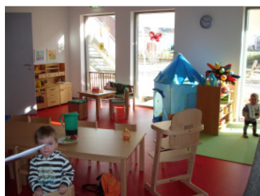
Besichtigung Raum i. Schwalbennest

Für die Auslegung des Kinderhauses wurden unsere Mitarbeiter/Innen befragt, verschiedene Institutionen und Einrichtungen besucht und deren Erfahrungen und Empfehlungen eingeholt.