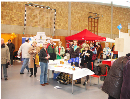
Der Kinderschutzbund in Bd. Schwartau

Wenn wir alle Wünsche und Empfehlungen berücksichtigen, könnte das Kinderhaus, wie auf dem Architektenentwurf aussehen. Dann haben wir allerdings noch eine deutliche Finanzierungslücke. Zur Zeit wird fieberhaft daran gearbeitet, eine günstigere Lösung zu finden, die auch noch alle Wünsche und Forderungen erfüllt. Eine mögliche zukünftige Erweiterung soll ebenfalls erhalten bleiben.